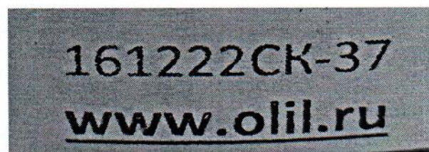
Рисунок 1.2 – Фотография маркировки манометра дифференциального показывающего Magnehelic 2000-60PA № 161222СК-37