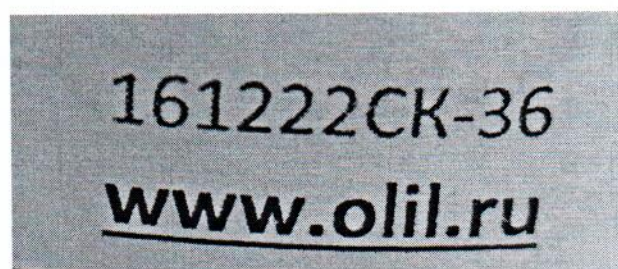
Рисунок 1.2 – Фотография маркировки манометра дифференциального показывающего Magnehelic 2000-60РА № 161222СК-36