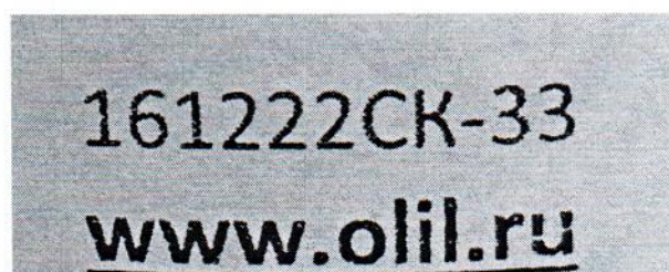
Рисунок 1.2 – Фотография маркировки манометра дифференциального показывающего Magnehelic 2000-60PA № 161222СК-33