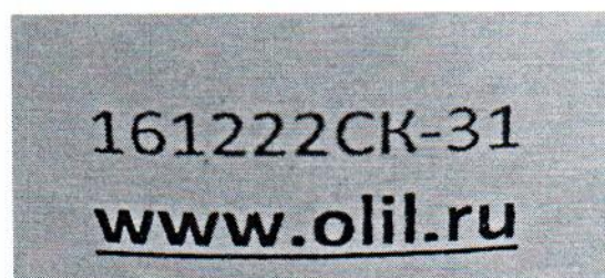
Рисунок 1.2 – Фотография маркировки манометра дифференциального показывающего Magnehelic 2000-60РА № 161222СК-31