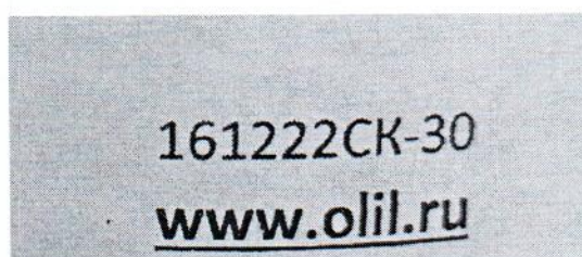
Рисунок 1.2 – Фотография маркировки манометра дифференциального показывающего Magnehelic 2000-60РА № 161222СК-30