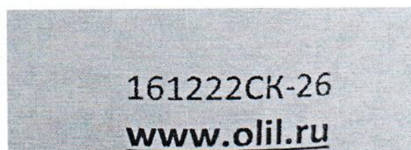
Рисунок 1.2 – Фотография маркировки манометра дифференциального показывающего Magnehelic 2000-60РА № 161222СК-26