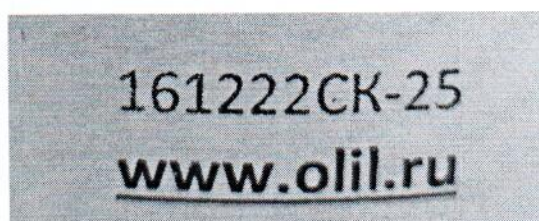
Рисунок 1.2 – Фотография маркировки манометра дифференциального показывающего Magnehelic 2000-60РА № 161222СК-25