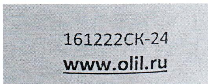
Рисунок 1.2 – Фотография маркировки манометра дифференциального показывающего Magnehelic 2000-60PA № 161222СК-24