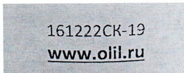
Рисунок 1.2 – Фотография маркировки манометра дифференциального показывающего Magnehelic 2000-60РА № 161222СК-19