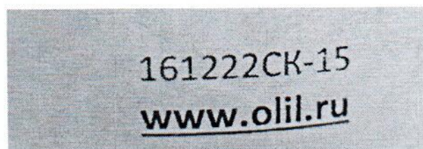
Рисунок 1.2 – Фотография маркировки манометра дифференциального показывающего Magnehelic 2000-60PA № 161222СК-15