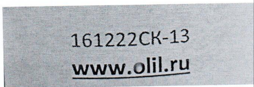
Рисунок 1.2 – Фотография маркировки манометра дифференциального показывающего Magnehelic 2000-60PA № 161222СК-13