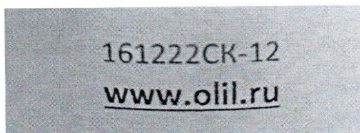
Рисунок 1.2 – Фотография маркировки манометра дифференциального показывающего Magnehelic 2000-60PA № 161222СК-12