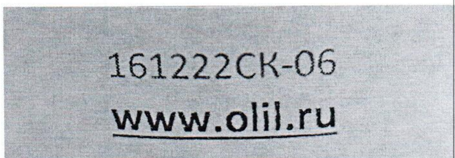
Рисунок 1.2 – Фотография маркировки манометра дифференциального показывающего Magnehelic 2000-60РА № 161222СК-06