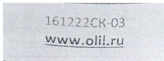
Рисунок 1.2 – Фотография маркировки манометра дифференциального показывающего Magnehelic 2000-60PA № 161222СК-03