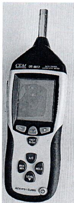
Рисунок 1.1 – Фотография общего вида измерителя уровня звука DT- 8852 № 160529443