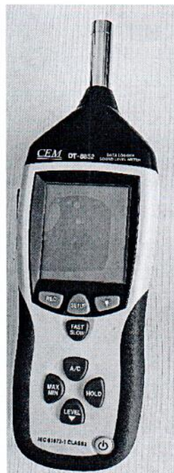
Рисунок 1.1 – Фотография общего вида измерителя уровня звука DT- 8852 № 160529427