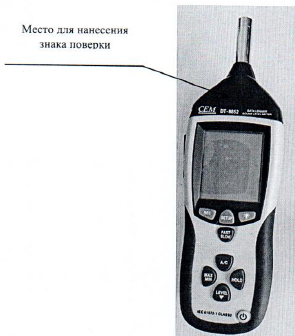
Рисунок 2.1 – Схема (рисунок) с указанием места для нанесения знака поверки

Схема (рисунок) с указанием места для нанесения знака поверки средств измерений