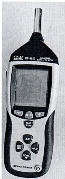
Рисунок 1.1 – Фотография общего вида измерителя уровня звука DT- 8852 № 150816188