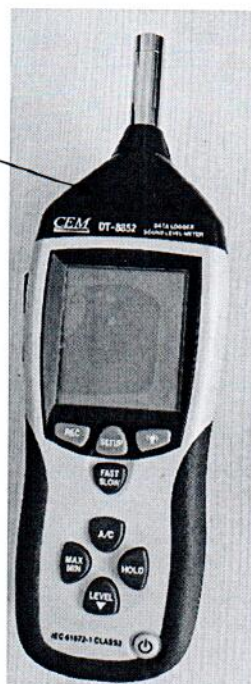
Рисунок 2.1 – Схема (рисунок) с указанием места для нанесения знака поверки