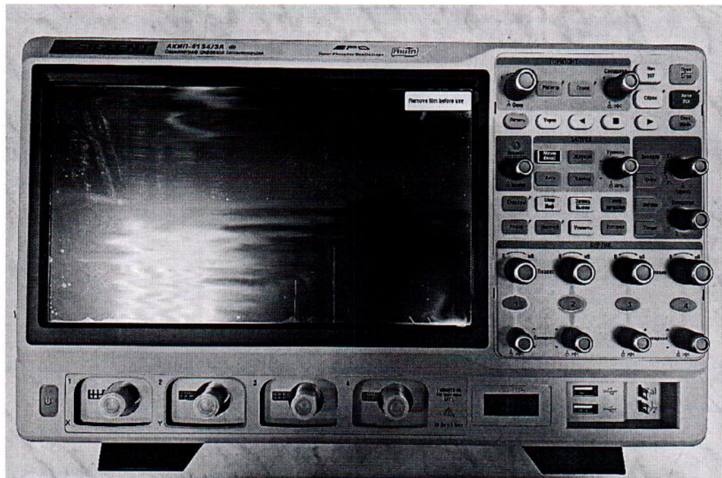
Рисунок 1.1 – Фотография передней панели осциллографа цифрового запоминающего АКИП-4134/3А № SDS5XB0Q7R0707

Фотографии общего вида средства измерений