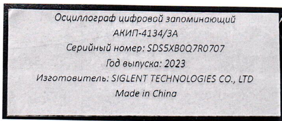
Рисунок 1.3 – Фотография маркировки осциллографа цифрового запоминающего АКИП-4134/3А № SDS5XB0Q7R0707