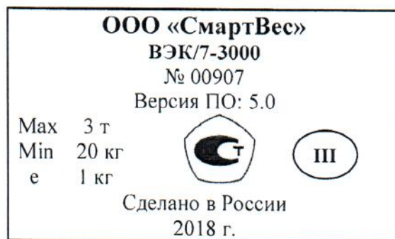
Рисунок 2 – Маркировка весов

Пломбировка весов изготовителем не предусмотрена.