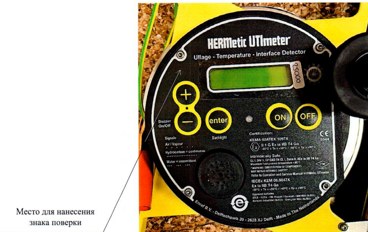
Рисунок 2.1 – Схема (рисунок) с указанием места для нанесения знака поверки средств измерений

Схема (рисунок) с указанием места для нанесения знака поверки средств измерений