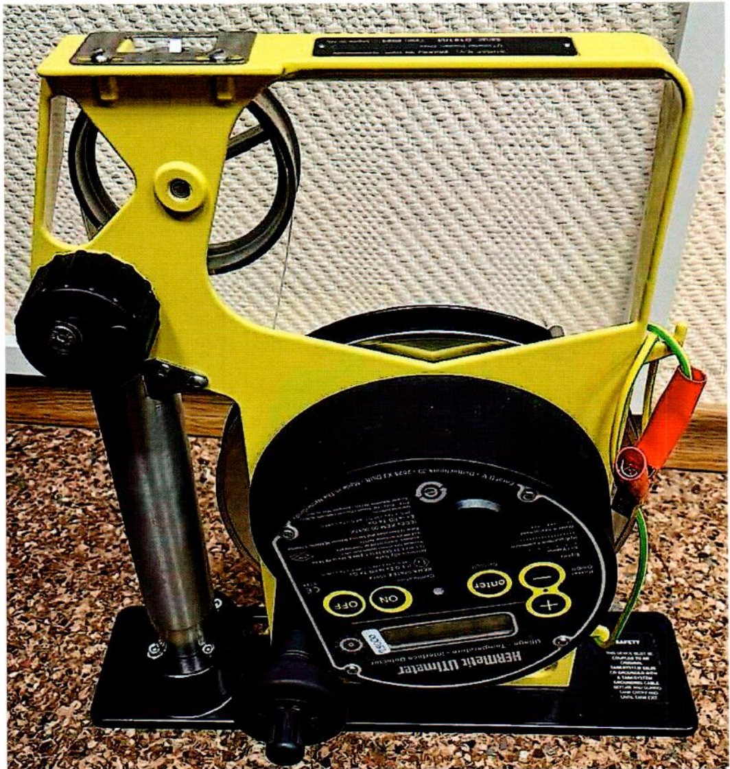
Рисунок 1.1 – Фотография общего вида уровнемера