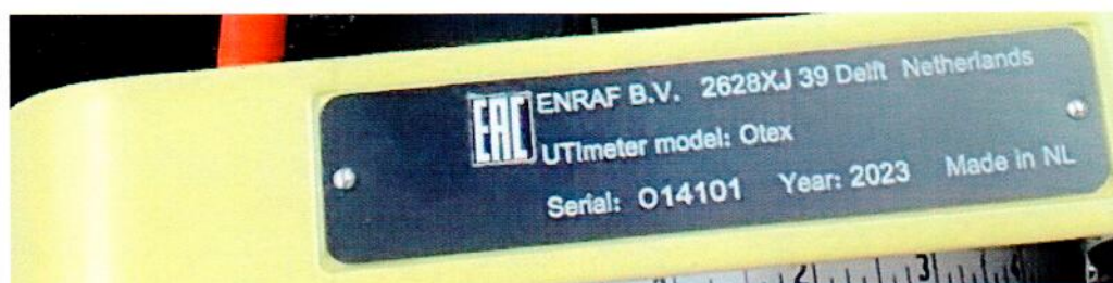
Рисунок 1.2 – Фотографии маркировки уровнемера