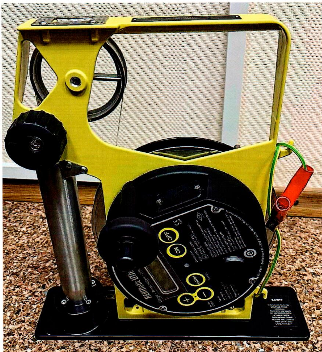
Рисунок 1.1 – Фотография общего вида уровнера