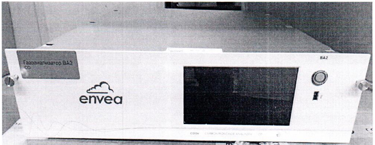
Рисунок 1.1 – Фотографии общего вида газоанализатора CO12e № 1644