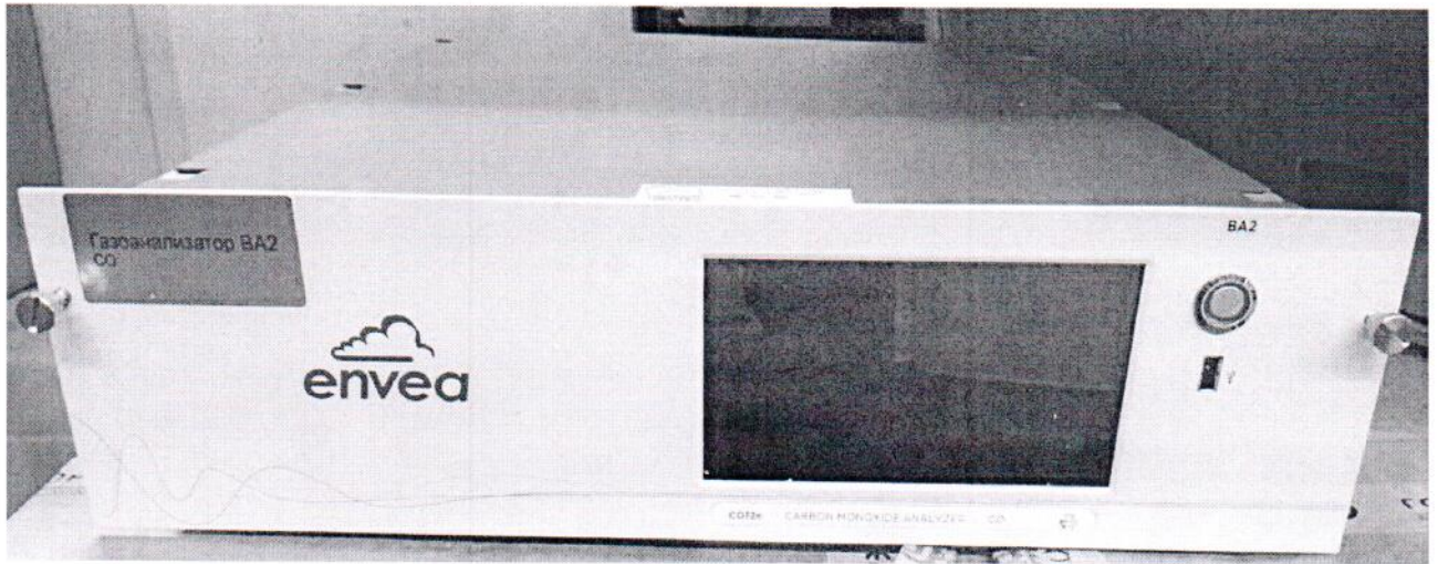
Рисунок 1.1 – Фотографии общего вида газоанализатора CO12e № 1653