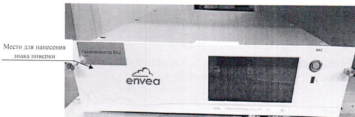
Рисунок 2.1 – Схема (рисунок) с указанием места для нанесения знака поверки

Схема (рисунок) с указанием места для нанесения знака поверки средств измерений