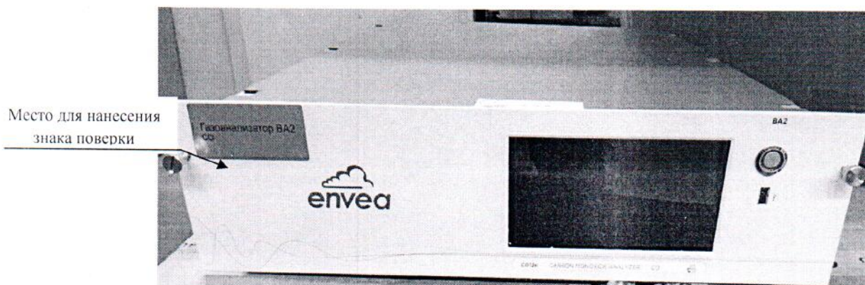
Рисунок 2.1 – Схема (рисунок) с указанием места для нанесения знака поверки

Схема (рисунок) с указанием места для нанесения знака поверки средств измерений