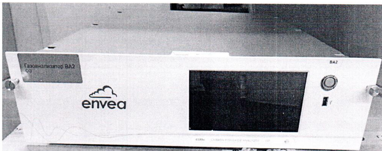
Рисунок 1.1 – Фотографии общего вида газоанализатора CO12e № 1652