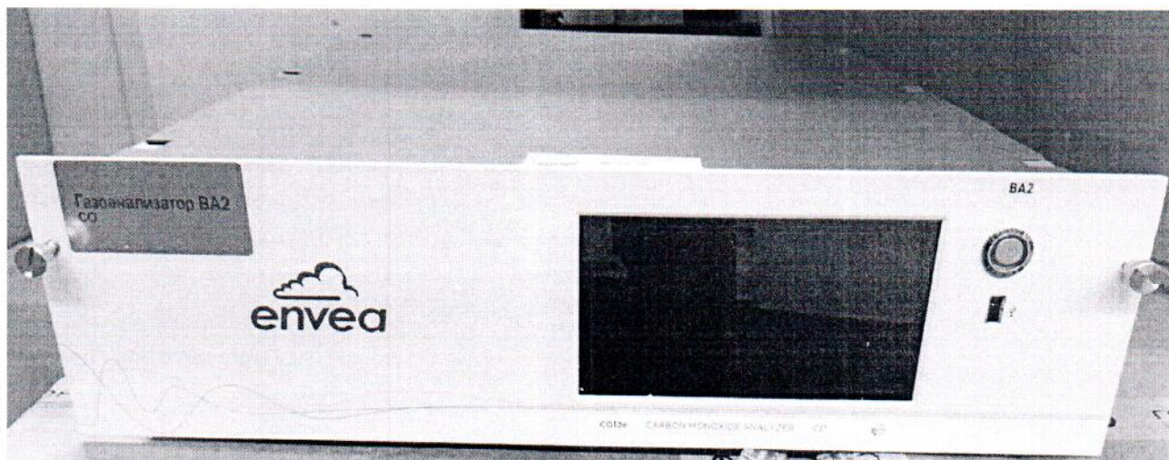
Рисунок 1.1 – Фотографии общего вида газоанализатора CO12e № 1647