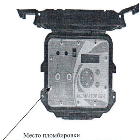
Рисунок 2 – Схема пломбировки от несанкционированного доступа, обозначение места нанесения знака поверки