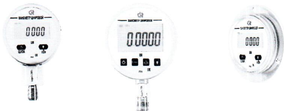
Рисунок 1 – Общий вид манометров

Заводской номер, состоящий из сочетания арабских цифр, наносится в маркировочную таблицу в виде наклейки на тыльной стороне корпуса манометра.