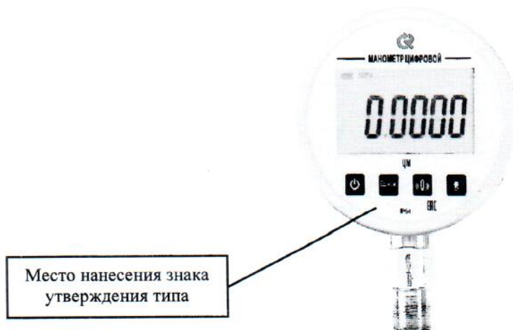
Рисунок 3 – Схема обозначения мест нанесения знака утверждения типа на манометр