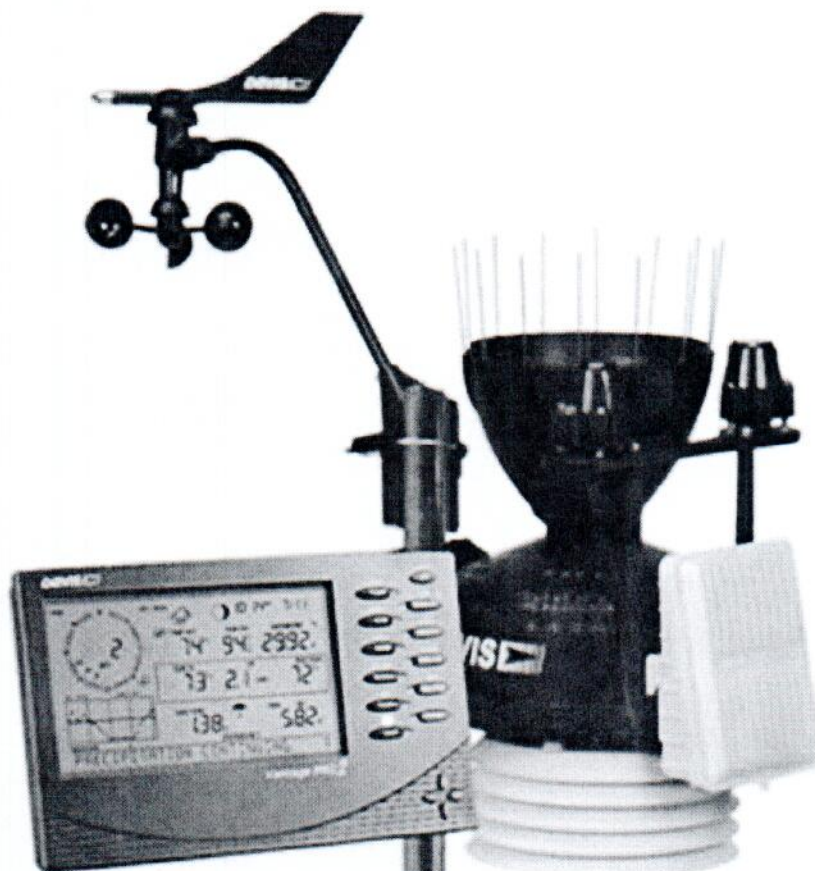
Рисунок 1.1 – Общий вид станции автоматической метеорологической Vantage Pro2 № BF21118011