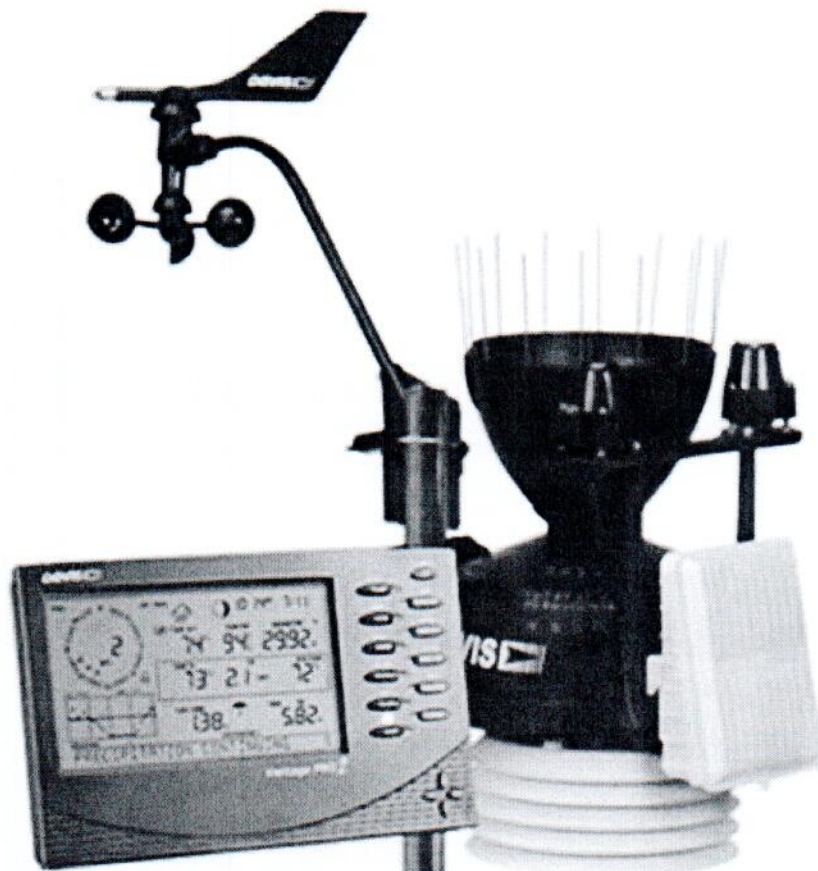
Рисунок 1.1 – Общий вид станции автоматической метеорологической Vantage Pro2 № BF211118013