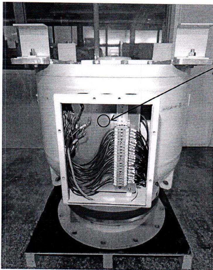
Схема (рисунок) с указанием места для нанесения знака поверки средств измерений