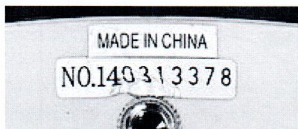
Рисунок 1.2 – Фотография маркировки измерителя уровня звука DT- 8852 № 140313378