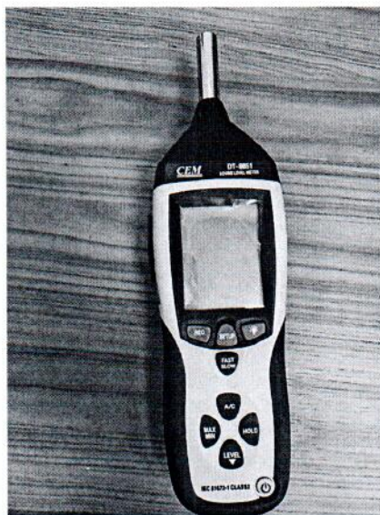
Рисунок 1.1 – Фотография общего вида измерителя уровня звука DT- 8851 № 12044606