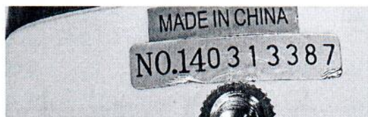
Рисунок 1.2 – Фотография маркировки измерителя уровня звука DT- 8852 № 140313387