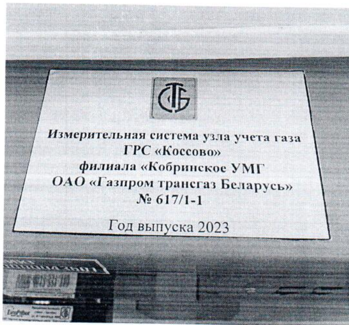
Рисунок 1.2 – Фотография маркировки ИС УУГ