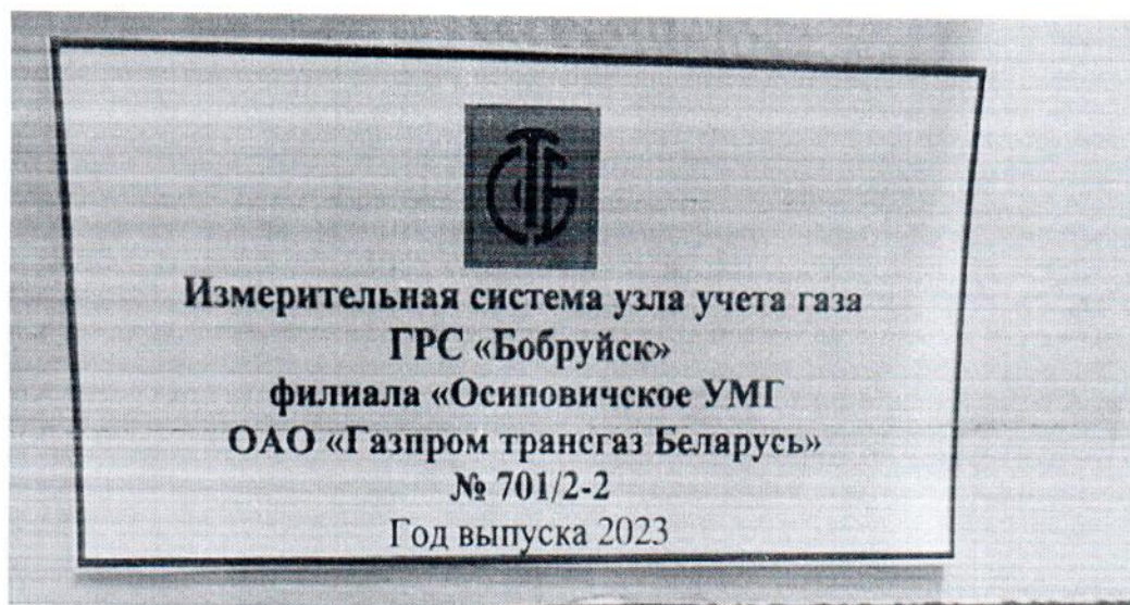
Рисунок 1.2 – Фотография маркировки ИС УУГ