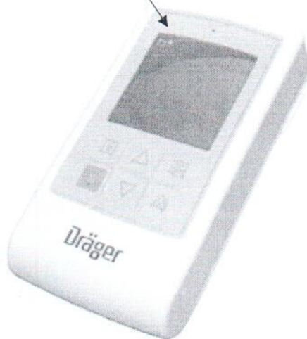
Рис. А.1. Место нанесения знака поверки в виде клейма-наклейки на мониторы пациента телеметрические Infinity M300, M300plus.