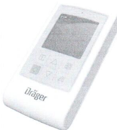
Рисунок 1 – Внешний вид монитора пациента телеметрического Infinity M300

Внешний вид мониторов приведен на рисунке 1.