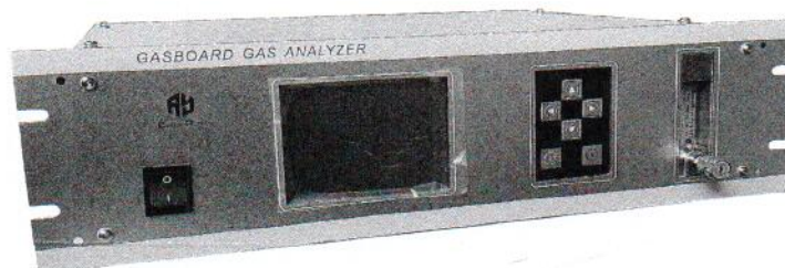
Рисунок 1.1 – Фотография общего вида. Газоанализатор Gasboard-3000Plus № 230801040001