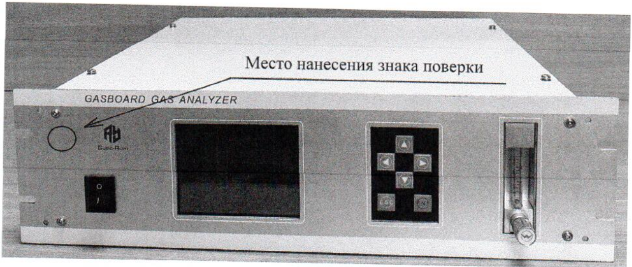
Рисунок 2.1 – Схема (рисунок) с указанием места для нанесения знака поверки

Схема (рисунок) с указанием места для нанесения знака поверки средств измерений