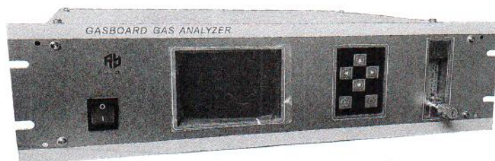
Рисунок 1.1 – Фотография общего вида. Анализатор газа Gasboard-3000Plus № 230703030001