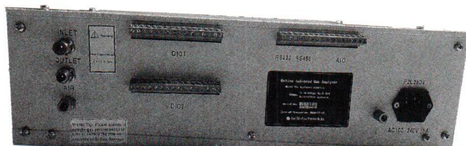
Рисунок 1.2 – Фотография общего вида. Задняя панель анализатора газа Gasboard-3000Plus № 230703030001