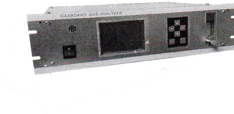
Рисунок 1.1 – Фотография общего вида. Анализатор газа Gasboard-3000Plus № 230703040001