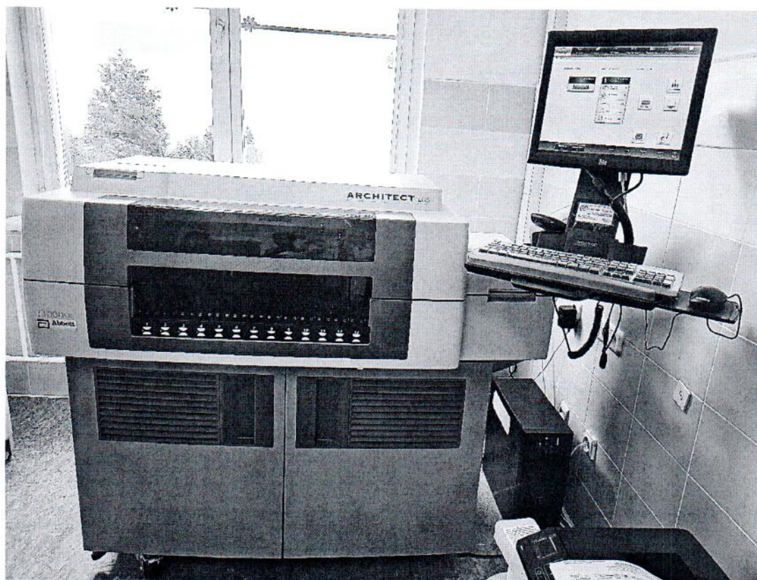
Рисунок 1.1 – Фотография общего вида анализатора автоматического иммунохимического: анализатора иммунохимического модульного ARCHITECT с принадлежностями: модель i1000sr (исполнение 1) с принадлежностями № i1SR65427