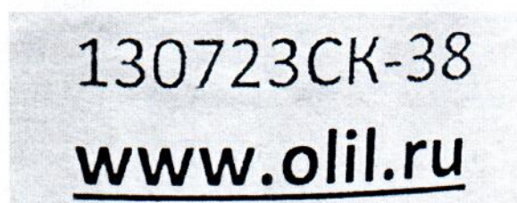
Рисунок 1.2 – Фотография маркировки манометра дифференциального показывающего Magnehelic 2000-500PA № 1302723СК-38