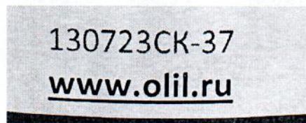
Рисунок 1.2 – Фотография маркировки манометра дифференциального показывающего Magnehelic 2000-500РА № 1302723СК-37