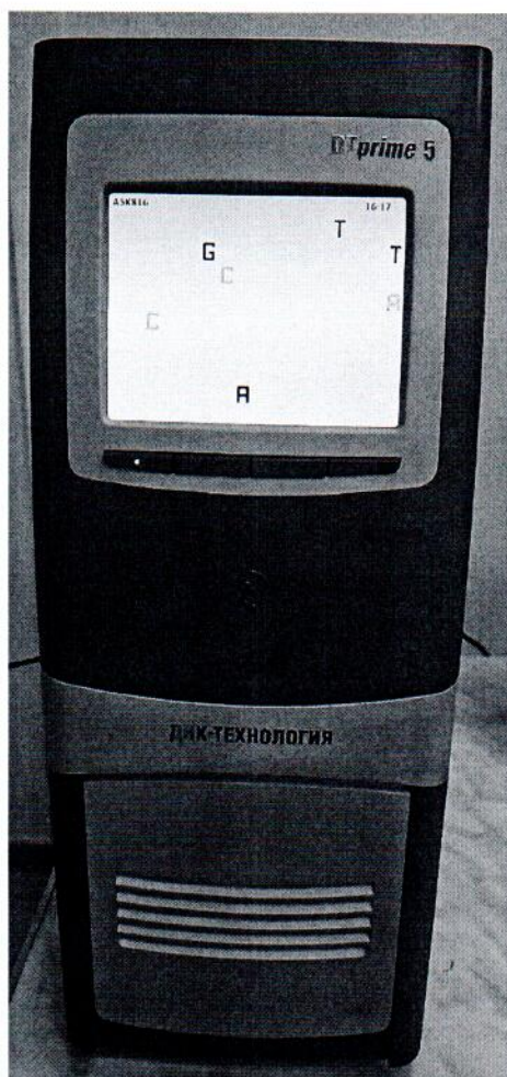
Рисунок 1.1 – Фотография общего вида амплификатора детектирующего ДТпрайм 5М1 № А5К816