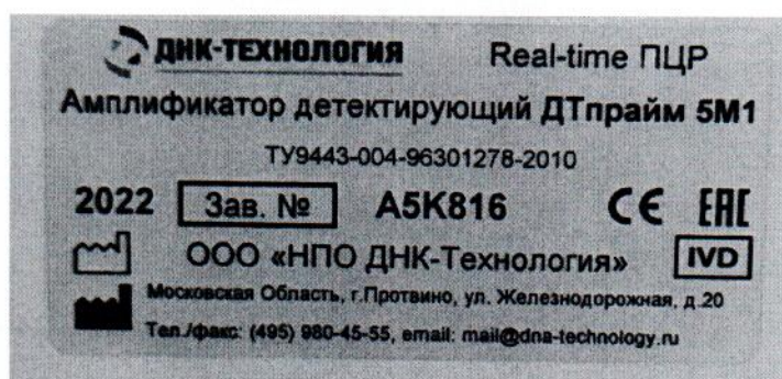
Рисунок 1.2 – Фотография маркировки амплификатора детектирующего ДТпрайм 5М1 № А5К816