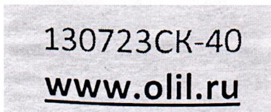
Рисунок 1.2 – Фотография маркировки манометра дифференциального показывающего Magnehelic 2000-500PA № 1302723СК-40