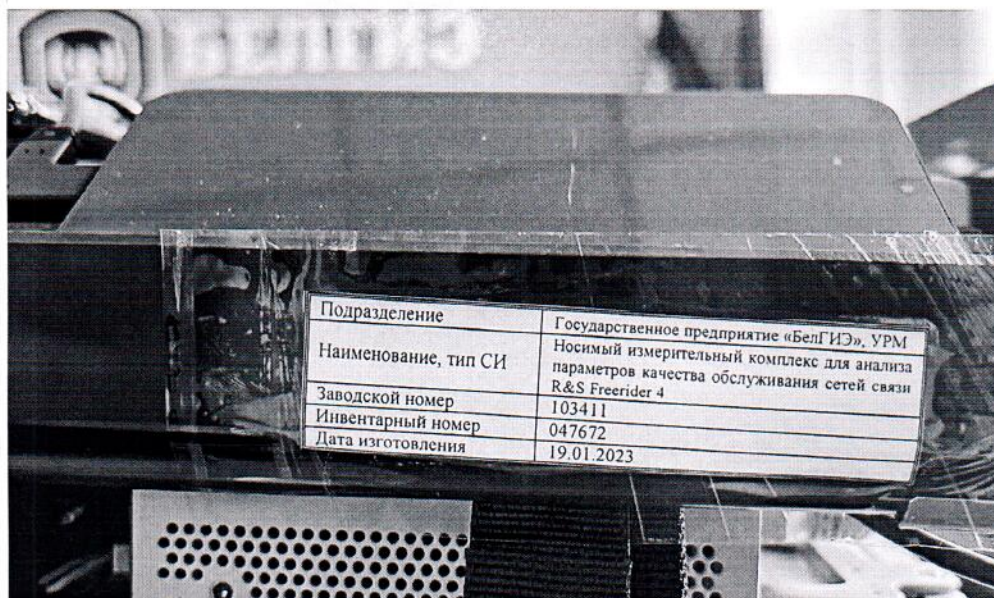
Рисунок 1.2 – Фотография маркировки носимого измерительного комплекса для анализа параметров качества обслуживания сетей связи R&S Freerider 4 № 103411