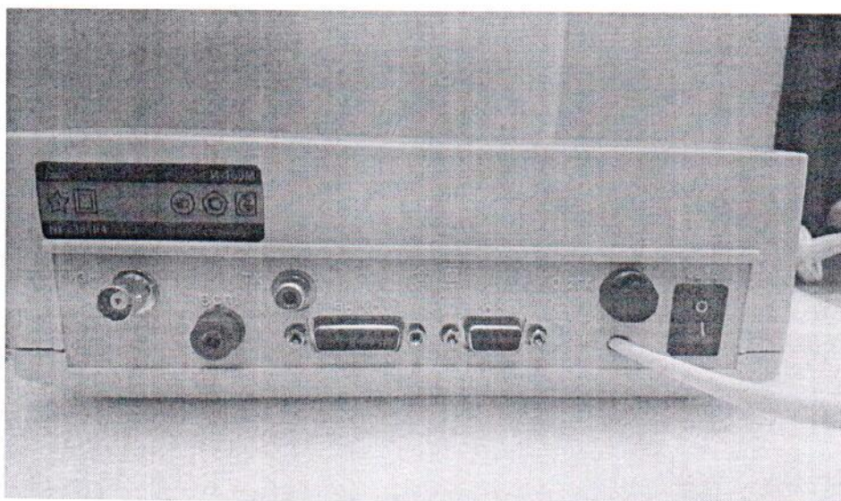
Рисунок 2.2 – Схема (рисунок) с указанием места нанесения маркировки ионмера лабораторного И-160М