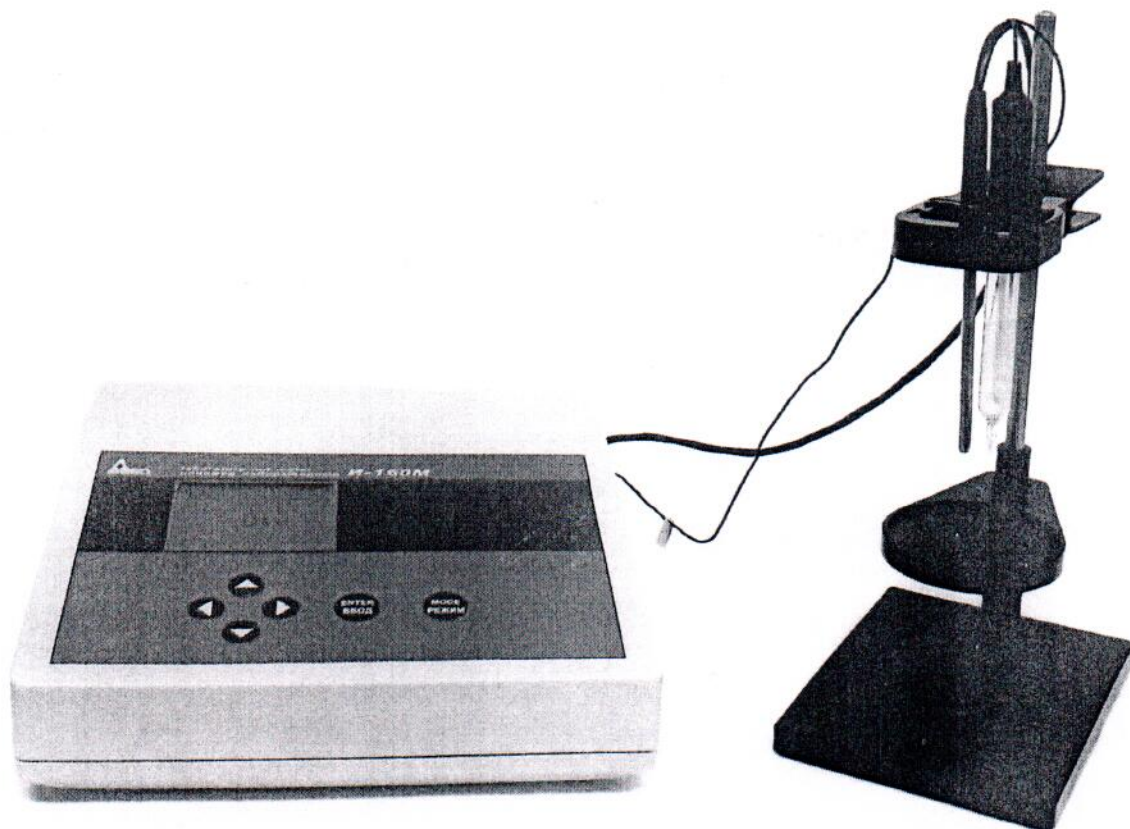
Рисунок 1.1 – Фотография общего вида иономера лабораторного И-160М