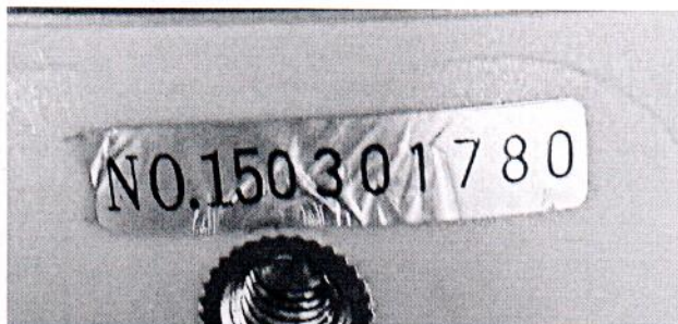
Рисунок 1.2 – Фотография маркировки измерителя уровня звука DT- 8852 № 150301780