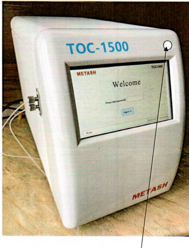
Схема (рисунок) с указанием места для нанесения знака поверки средств измерений