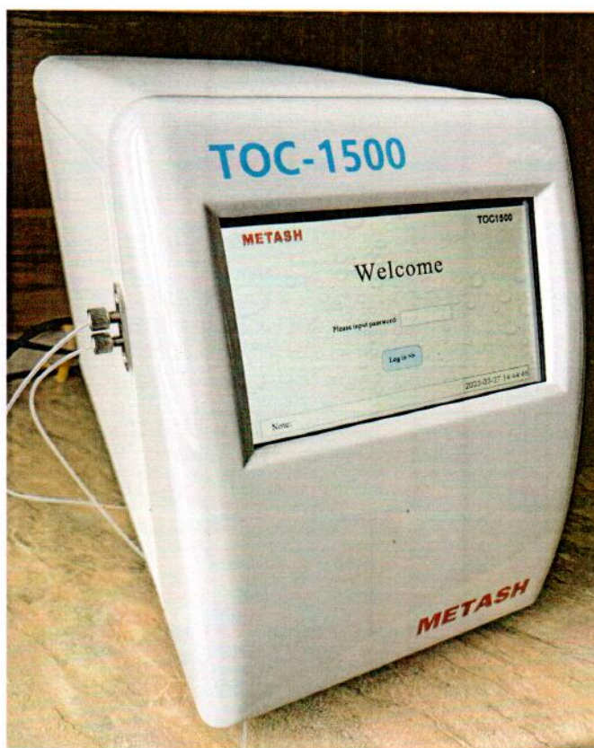
Рисунок 1.1 – Фотография общего вида анализатора общего органического углерода TOC1500 № MS-TOC-230519

Фотографии общего вида средств измерений