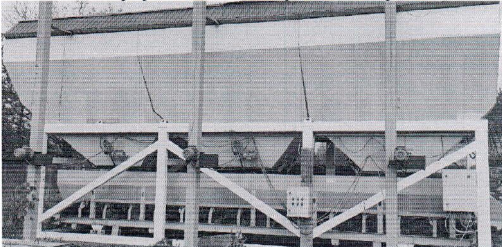
Рисунок 1.1 – Внешний вид дозирующего комплекса ДКМ-60 № 757