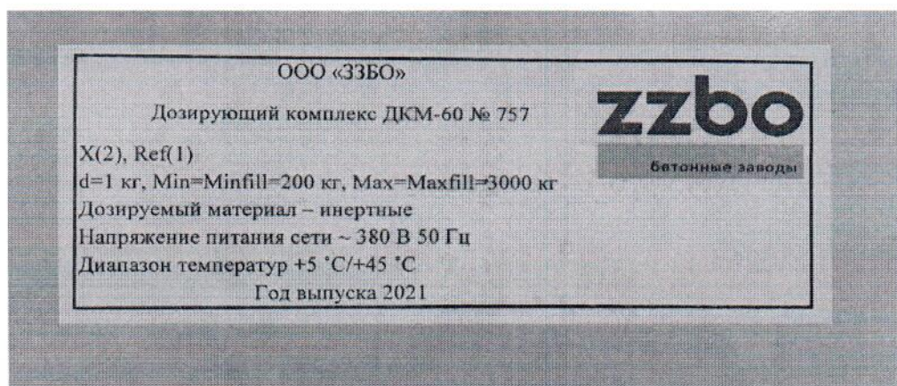
Рисунок 1.3 – Маркировка дозирующего комплекса ДКМ-60 № 757