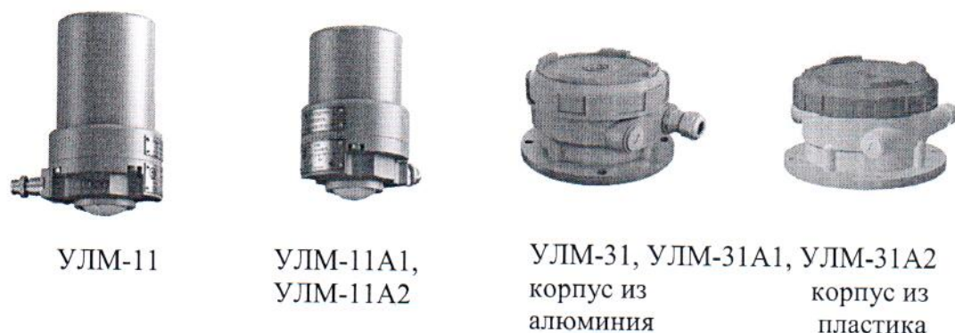
Рисунок 1 – Общий вид уровнемеров

Для конфигурирования уровнемеров и их диагностики при помощи персонального компьютера может использоваться сервисная программа «Конфигуратор» (Ulmcfg). Общий вид уровнемеров представлен на рисунке 1.